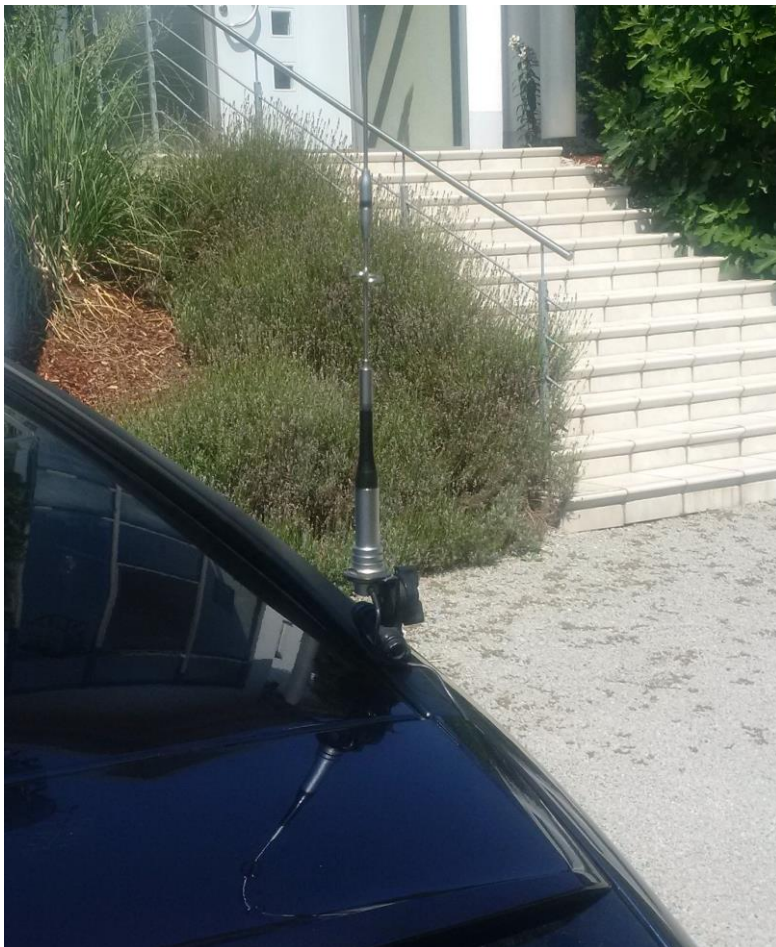
Montierte Antenne SG-M803N